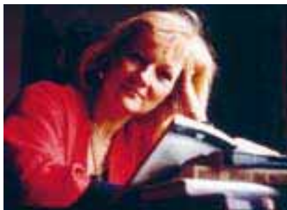
Griselda Pollock.

Leder af Center for Kulturanalyse, Teori og Historie ved universitetet i Leeds. Pollock har bl.a. skrevet "Differencing the Canon – Feminist Desire and the Writing of Art's Histories" (1999). Hendes nyere forskning omhandler bl.a. Holocaust, psykoanalyse og jødisk kunsthistorie. I 2007 udkommer flere af hendes seneste værker, bl.a.: "Museums after Modernism: Strategies of Engagement" samt "Encounters in the Virtual Feminist Museum".