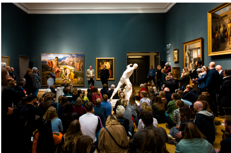
Der skal sikres diversitet, ligeværd og reel inklusion i de danske kunstinstitutioner. Event midt i kunsten.

I august lancerede vi en række anbefalinger, der skal gøre det muligt at sikre diversitet, ligeværd og reel inklusion i de danske kunstinstitutioner. De danske kunstmuseer, kunsthaller og udstillingssteder har en vigtig og helt central rolle som kulturbærende og kulturfremmende institutioner, og derfor har de også en forpligtelse til at favne og repræsentere hele befolkningens nuancerede sammensætning i arbejdet med kunstnere i deres udstillinger, samlinger, aktiviteter, formidling og forskning. Det handler ikke kun om, at ubalancen mellem antallet af mandlige og kvindelige kunstnere, der udstiller på landets museer, kunsthaller og udstillingssteder, udlignes, men i lige så høj grad om, at