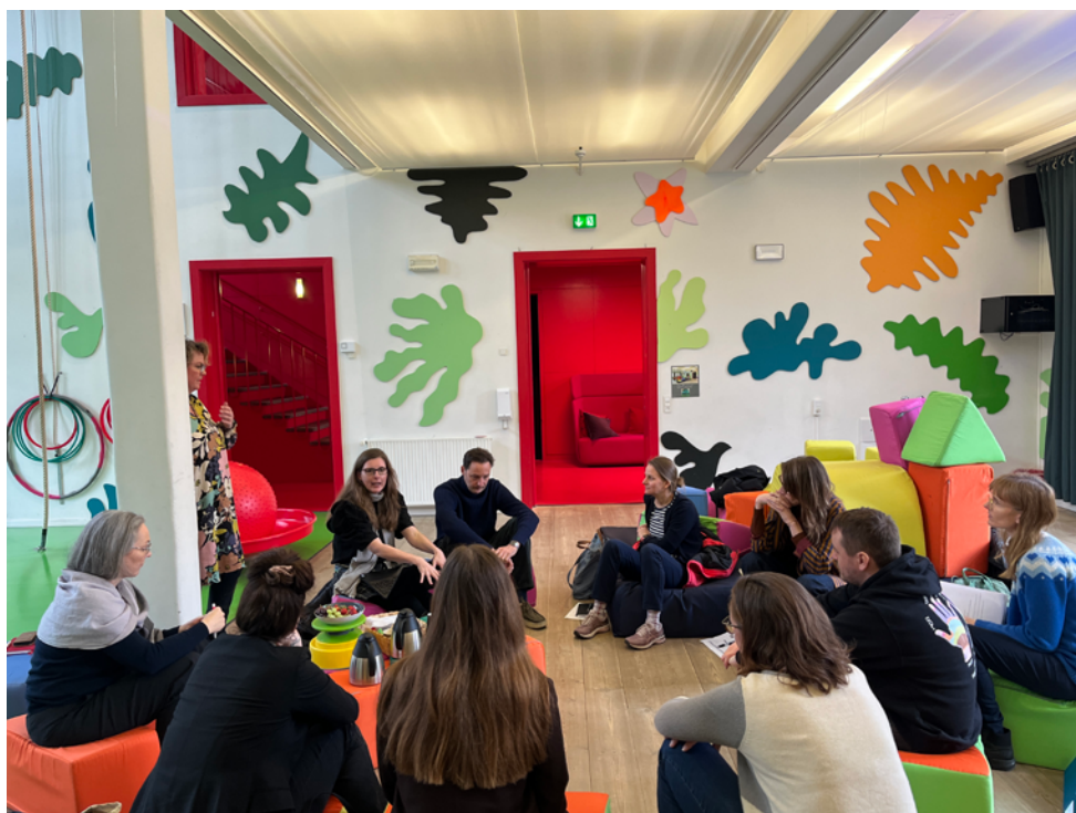
Workshop på BKF og KL's kommunenetværksmøde i Kolding i marts.

Også i år har vi afholdt en velbesøgt kommunekonference. Det skete i februar på Kulturmaskinen i Odense med inspirerende oplæg fra udenlandske og danske oplægsholdere. Konferencedeltagerne var blandt andet medlemmer af kommunale billedkunstråd, kulturkonsulenter og professionelle billedkunstnere, der alle blev klogere på, hvordan kunst i det offentlige rum kan komme op at stå, men også gav en fornemmelse af, hvor mange myndigheder,